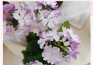
園芸品種「白砂青松」

たくさん咲いているさくらそうを掘りとり鉢に植え、それを一鉢四文で江戸市中に振り売っていたとされています。