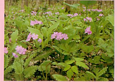
野生のサクラソウ

さくらそうは、野生種の栽培と鑑賞が室町時代に京都の宮廷文化で始まり、江戸時代に多くの園芸品種が作り出されました。その育種過程の詳細は不明でしたが、最近の遺伝子解析により園芸品種の起源となった集団が明らかになっています。今回の展示では、さくらそうの園芸品種を通して、日本人が野生の植物の様々な遺伝的特性に気づき、愛で、育んできた歴史があることをお伝えします。