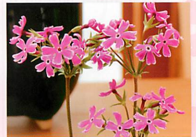
園芸品種「南京小桜」