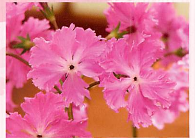
園芸品種「美女の舞」