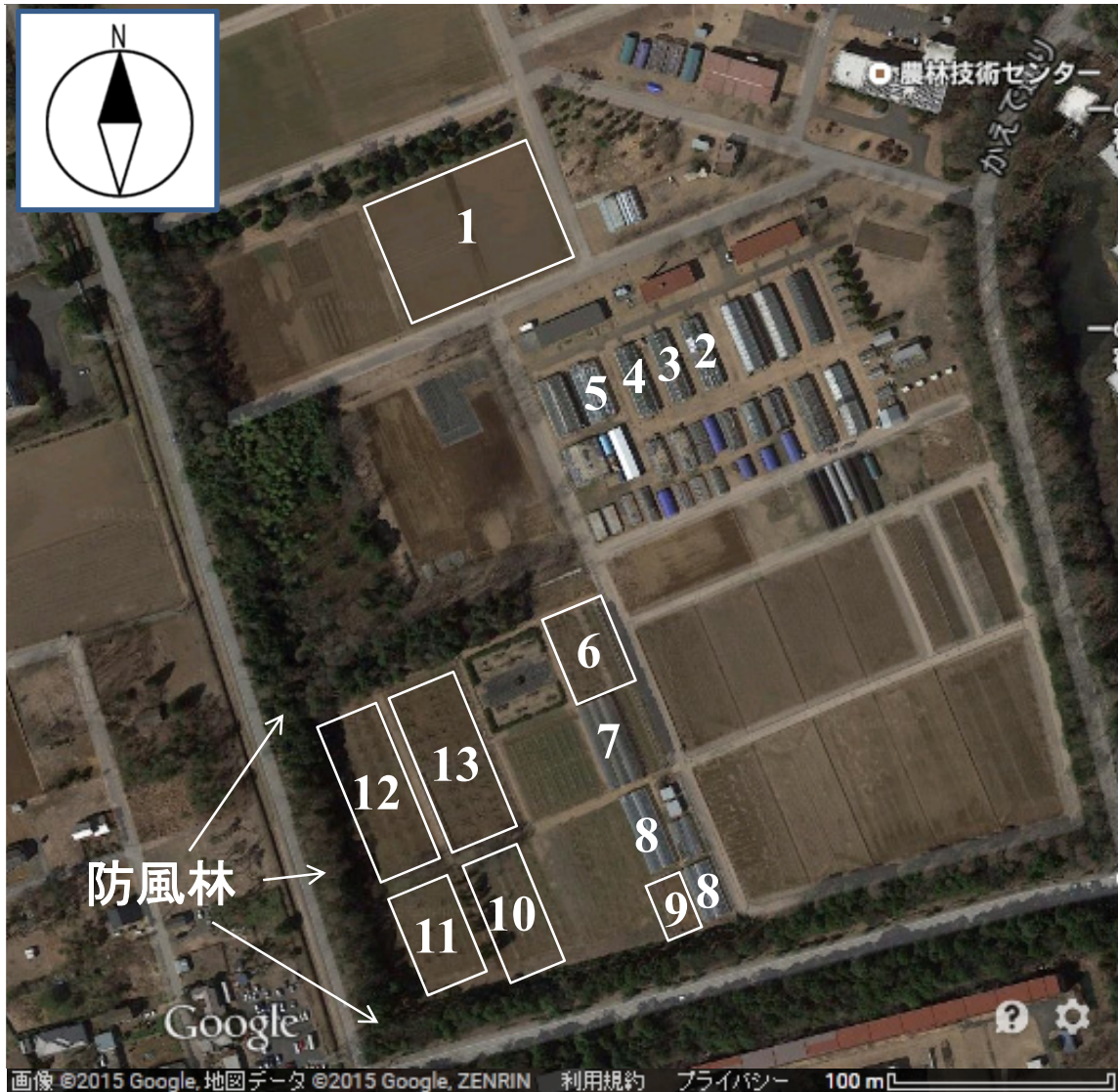
図2 農林技術センターにおける園芸作物の栽培位置

1(露地);カブ、ダイコン、タマネギ、ハクサイ、キャベツ、トウモロコシ、ナス、ニンジン、ヒマワリ、2(G4温室);ナス(苗)、3(G5温室);トマト(大玉)、4(G6温室);ミニトマト、5(F1ハウス);クウシンサイ、コマツナ、サンチュ、ブロッコリー、ミズナ、リーフレタス、レタス、6(露地);キウイフルーツ、7(ハウス);ブドウ、8(ハウス);ブルーベリー、9(露地);ブルーベリー、10(露地);ウメ、11(露地);カキ、12(露地);クリ、13(露地);ナシ。なお、1は野菜圃場を、6~13は果樹園を示す。